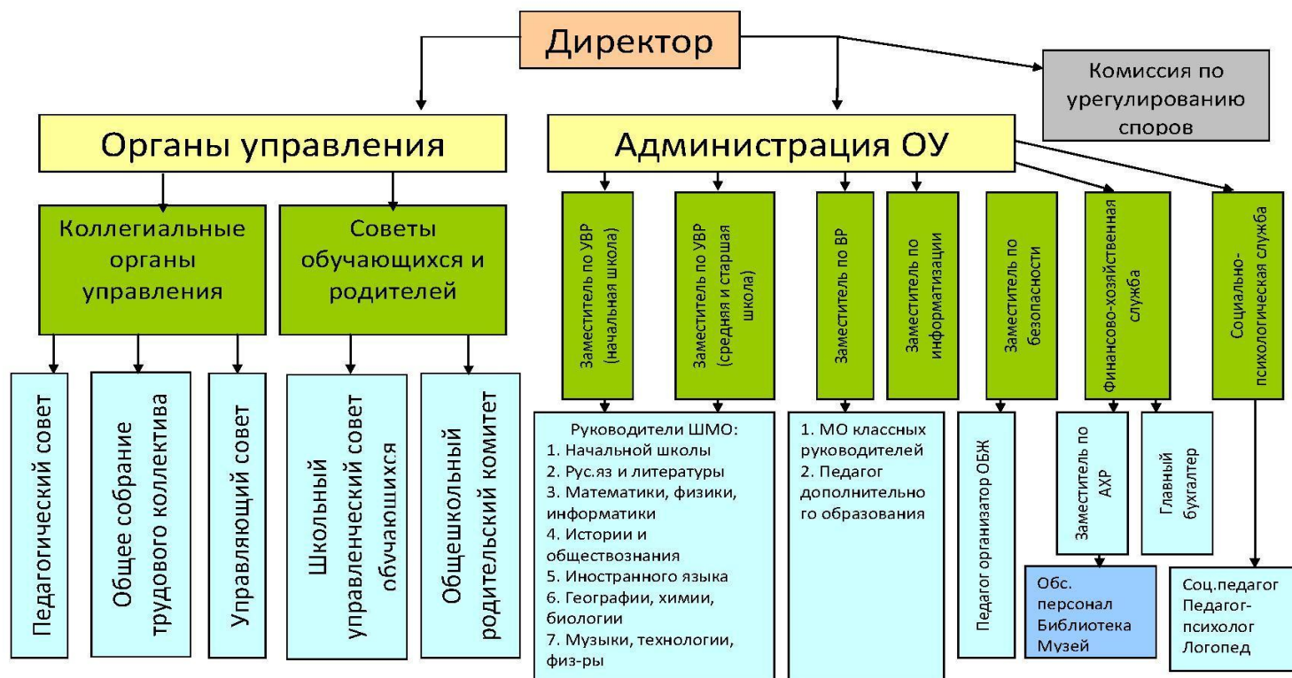
Рис.1.: Структура управления образовательной организацией.

Все перечисленные структуры совместными усилиями решают основные задачи образовательного учреждения и соответствуют Уставу.